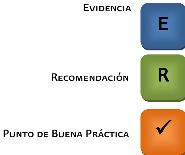
Tabla de referencia de símbolos empleados en esta guía:

Los sistemas de gradación utilizados en la presente guía son: Shekelle, Scottish Intercollegiate y Scheme Given.